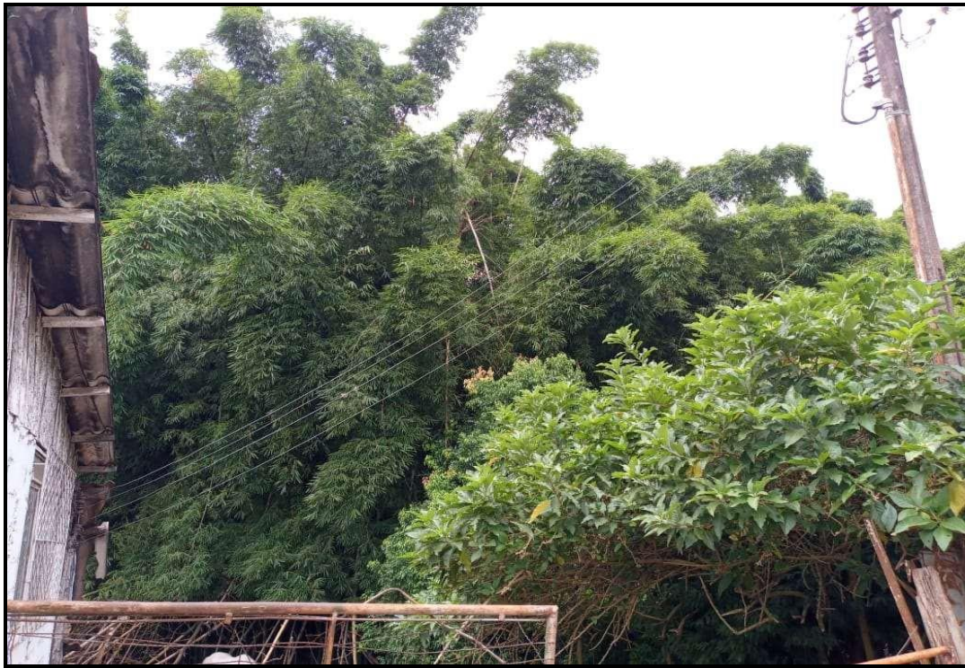
Touceira ao fundo da agropecuária