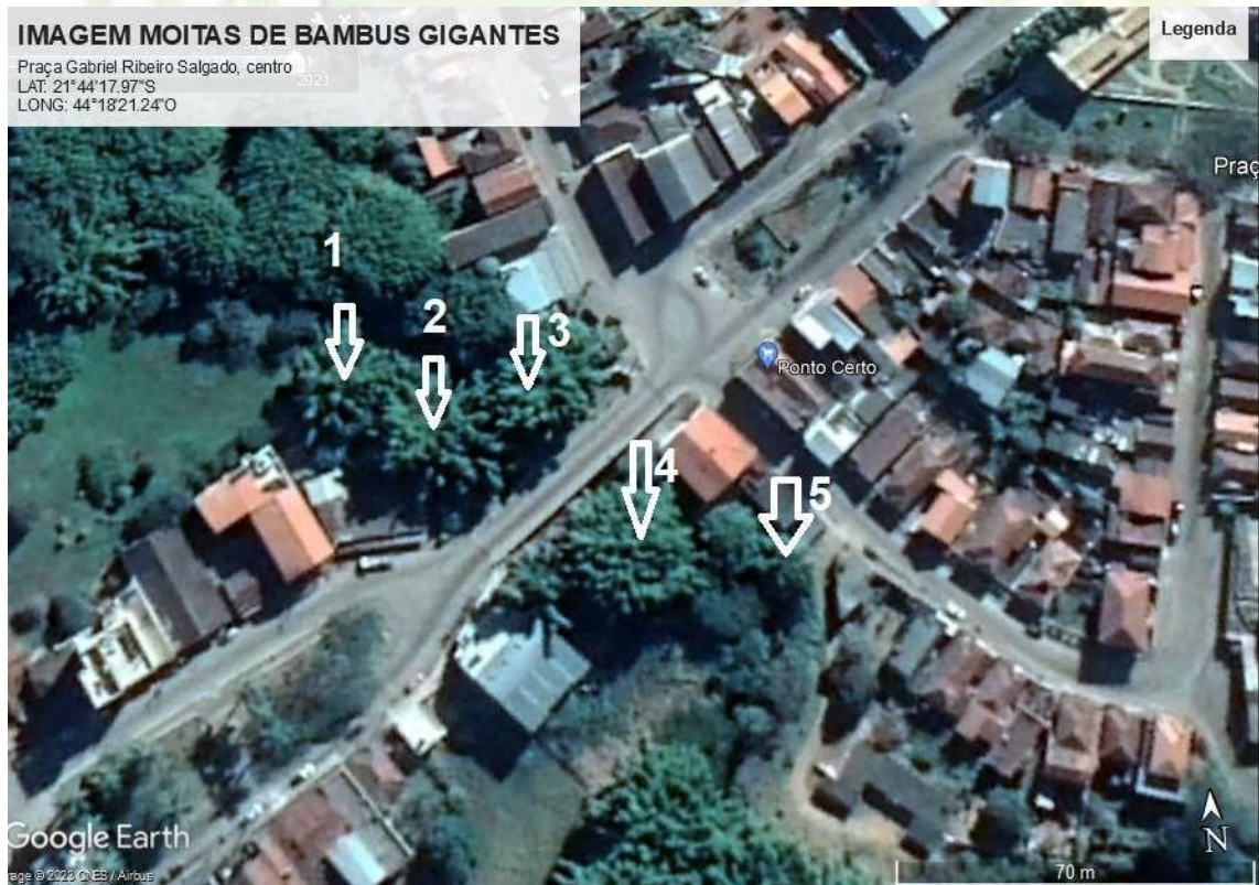
Imagem de satélite de todas as touceiras