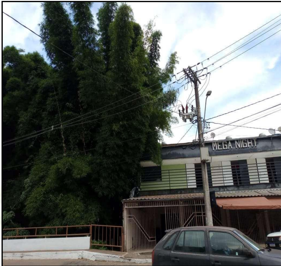
Touceira ao lado da mega night