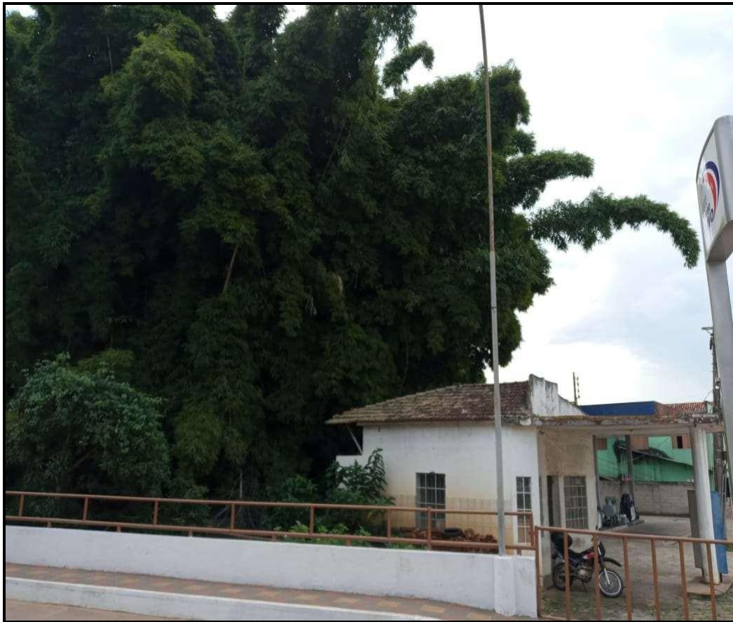
Touceira ao fundo do posto