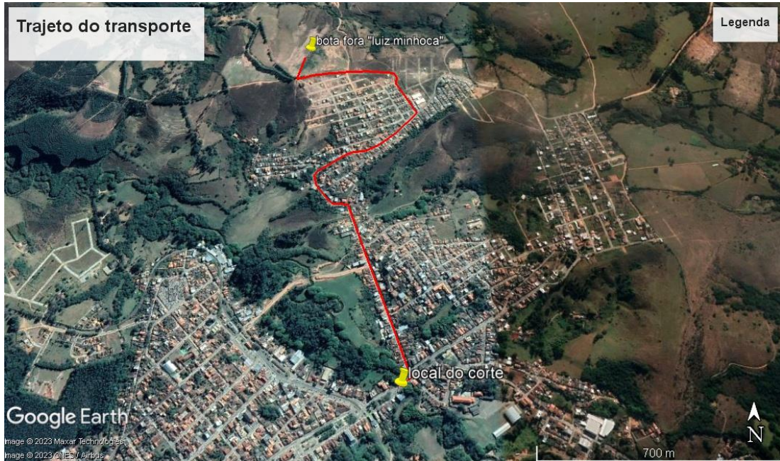
Imagem de satélite do trajeto do transporte das touceiras