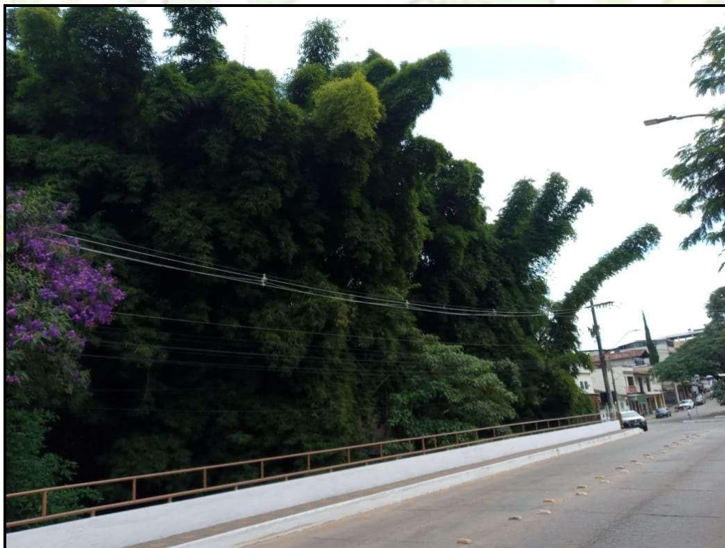
Touceira ao lado da mega night